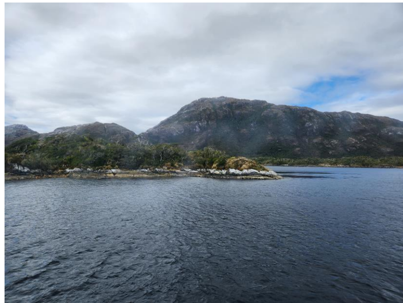
Archipiélago Madre de Dios, Región de Magallanes