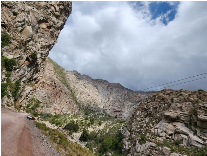
Río Colorado, Región Metropolitana